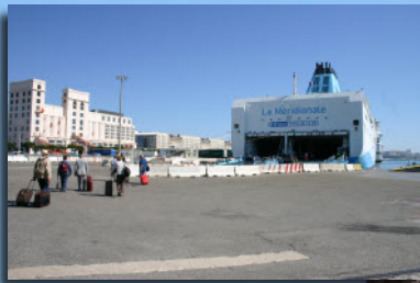
L'embarquement à Marseille

Cette année la Section du Rhône a souhaité faire découvrir à ses membres les merveilles naturelles et historiques de l'ouest et du centre de la Corse. Un voyage dans une période où le maquis est en fleurs, la mer d'azur et la montagne parée de verdure. Plutôt qu'un long texte austère, nous avons voulu faire rêver ceux qui n'ont pas pu faire ce beau voyage en l'illustrant par quelques photos.