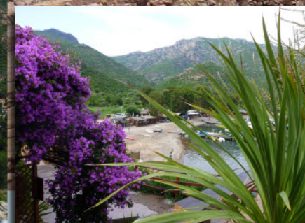
Girolata village accessible que par la mer