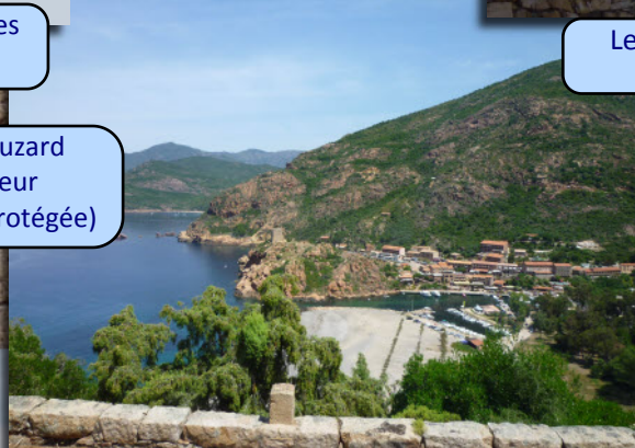
Le golfe de Porto