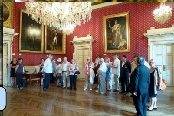
Dans le salon Napoléonien de la Mairie d'Ajaccio