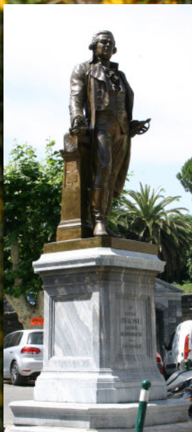
Corté, Pascal Paoli