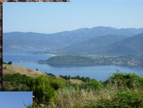
Le Golfe de Sagone