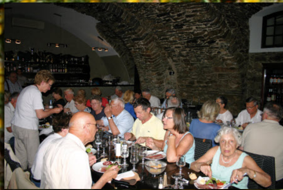
Corté, le repas dans les « schistes » corses de la cave souterraine