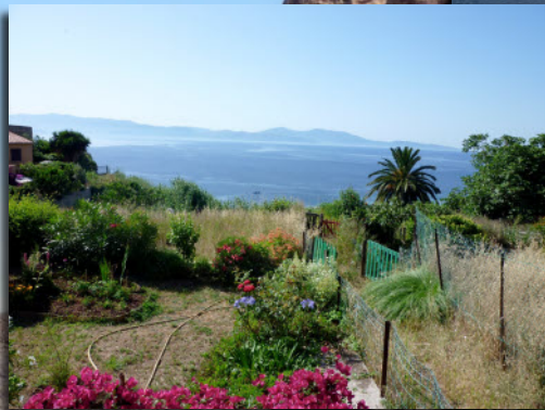
Cargèse un jardin