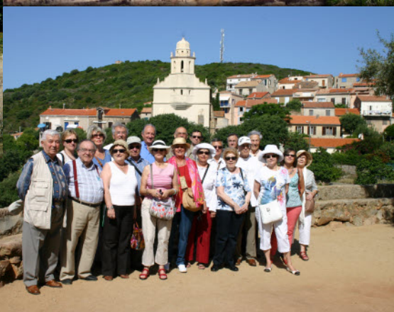
Les sociétaires à Cargèse au fond l'église orthodoxe