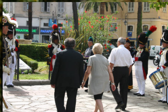
Cérémonie pour ranimer la flamme place Napoléon