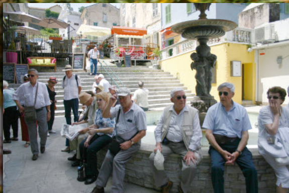
Corté, une pause