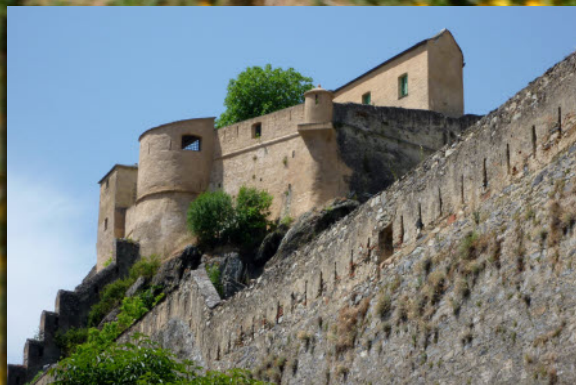
Corté, la citadelle du XIVème