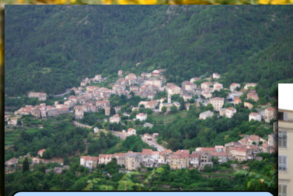
Venaco, village avec plus de 2000 ans d'histoire, dans la forêt de châtaigniers.