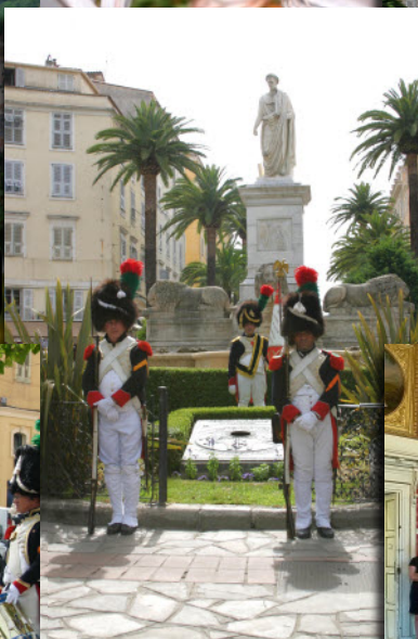
La garde Napoléonienne et le drapeau