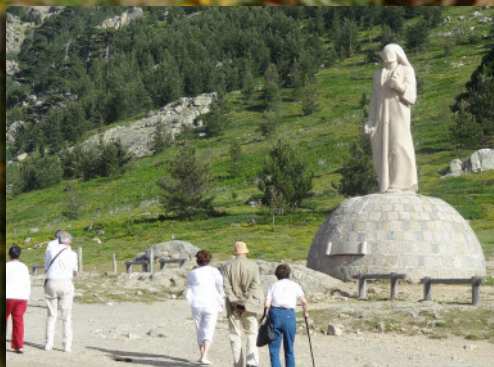
Col de Vergio limite des 2 corses géologiques sud et alpine, et le Christ majestueux