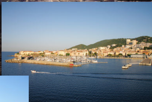
L'arrivée à Ajaccio