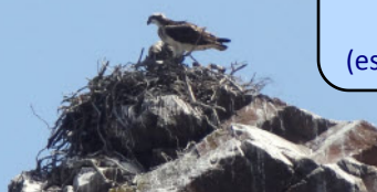
Le balbuzard pêcheur (espèce protégée)