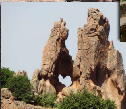
Dans les Calanches, avec leurs sculptures naturelles et les « Tafoni »