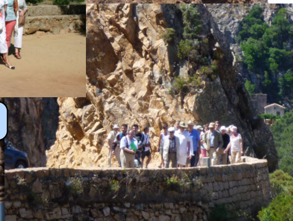
Le groupe dans le granite rose des calanches de Piana