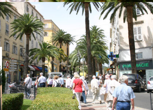
Ajaccio, découverte de la ville