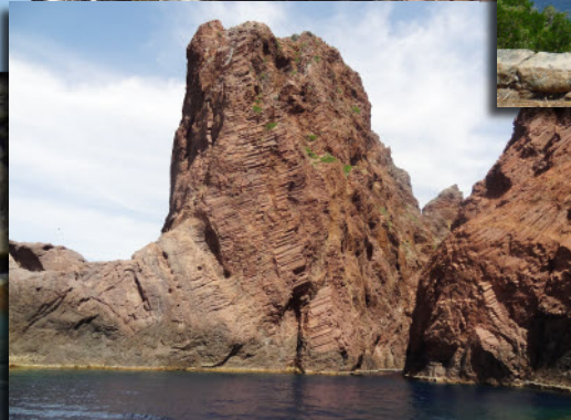
Les orgues de rhyolite de Scandola réserve mondiale de l'Unesco